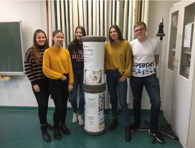
Unterrichtsprojekt zur Weimarer Republik